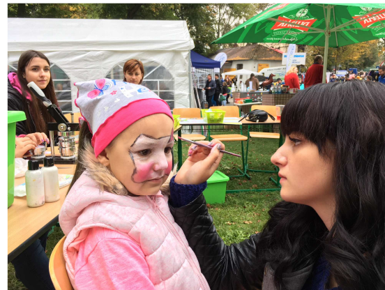
REKLAMNÍ GRAFIKA - PRAXE