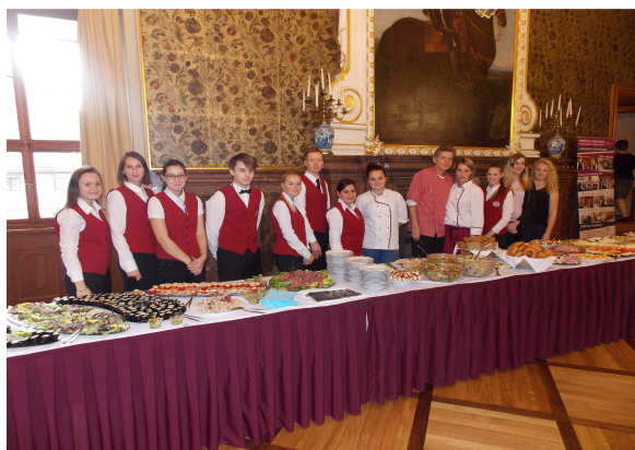
V SENÁTU ČR