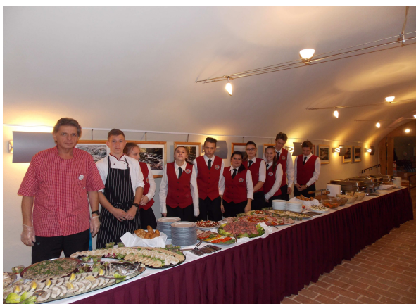
RAUT PRO HOSPODÁŘSKOU KOMORU ČR