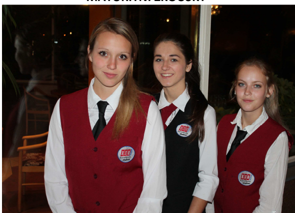
PRAXE V TOPHOTELU PRAHA