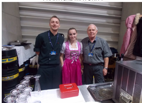
GASTROFEST V ČESKÝCH BUDĚJOVICÍCH