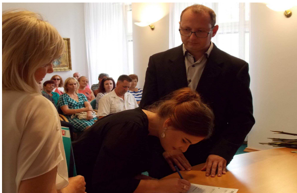
PŘEDÁNÍ MATURITNÍHO VYSVĚDČENÍ