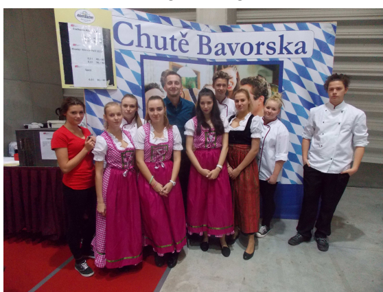
GASTROFEST V ČESKÝCH BUDĚJOVICÍCH