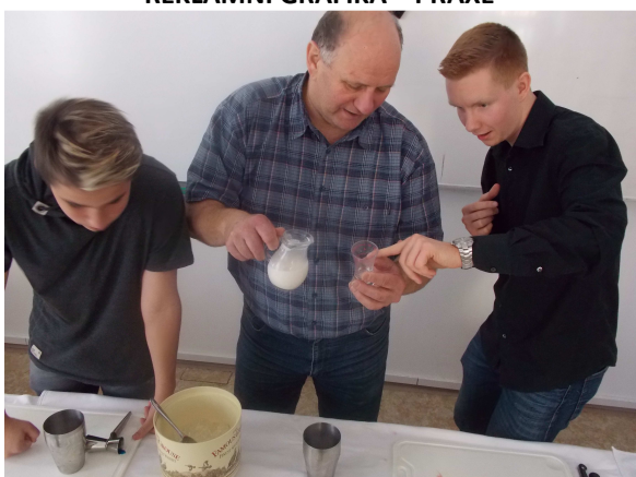
TAKHLE SI TADY ŽIJEME ... BARMANI