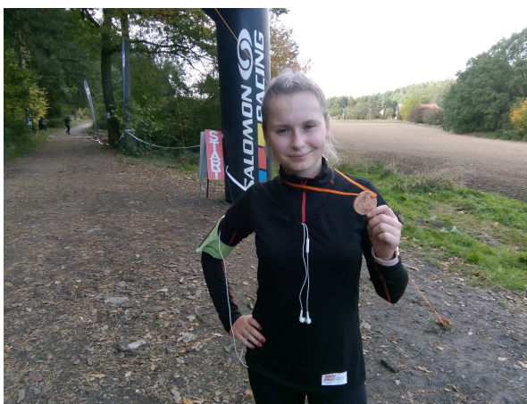
SOUTĚŽE – BĚH MĚSTA STRAKONICE