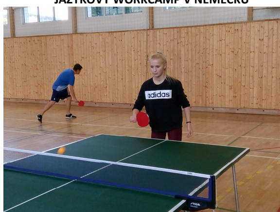
SOUTĚŽE – STOLNÍ TENIS