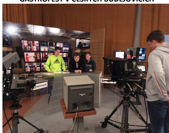
EXKURZE V ČESKÉ TELEVIZI