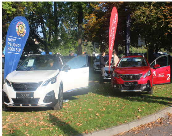
VÁCLAVSKÁ POUŤ- VÝSTAVA AUT