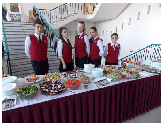
SLAVNOSTNÍ RAUT V ČESKÝCH BUDĚJOVICÍCH