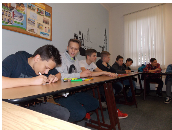
TAKHLE SI TADY ŽIJEME ... ŽÁCI ZŠ