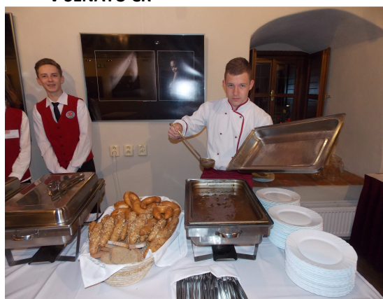
PRAXE ŽÁKŮ – RAUT KONFERENCE LÉKAŘŮ