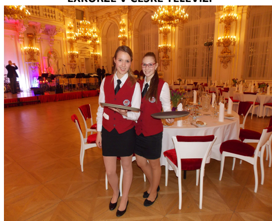
CHARITATIVNÍ PLES PREZIDENTA ČR