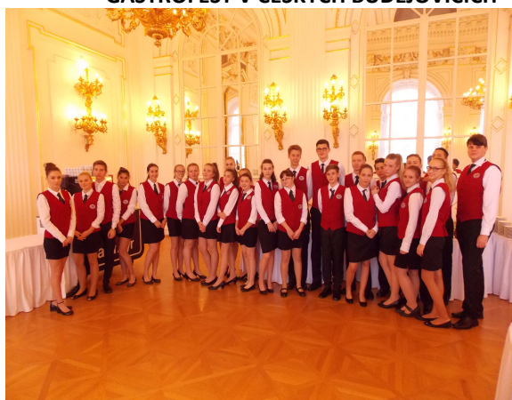
OSLAVA VZNIKU ČR NA PRAŽSKÉM HRADĚ