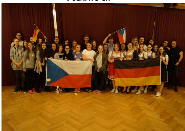
JAZYKOVÝ WORKCAMP V NĚMECKU