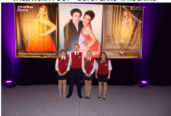
TANEČNÍ – ZÁSADY SPRÁVNÉHO STOLOVÁNÍ