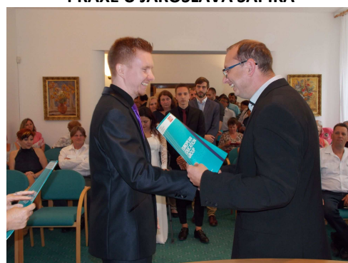
PŘEDÁNÍ MATURITNÍHO VYSVĚDČENÍ