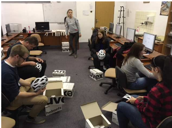
REKLAMNÍ GRAFIKA – PRAXE