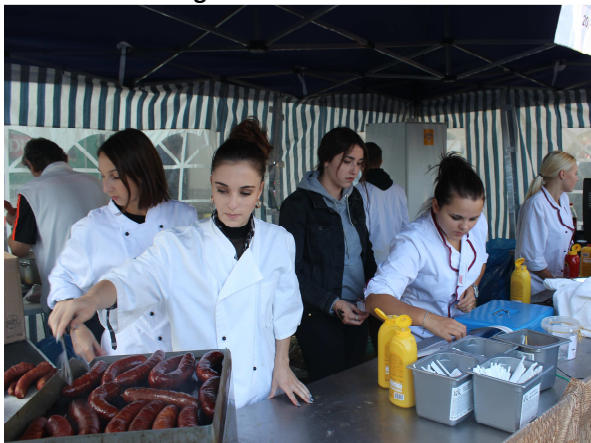
VÁCLAVSKÁ POUŤ – BUFET ŽÁKŮ 4. ROČNÍKU