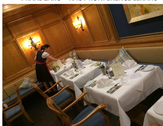
STÁŽE V HOTELU MAXIMILIAN