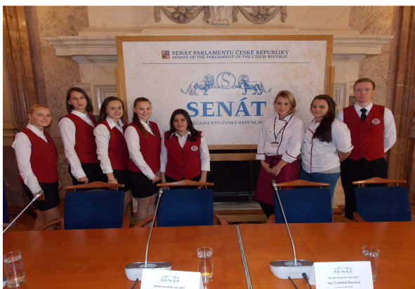
V SENÁTU ČR