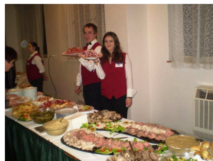
RAUT PRO BISO KEIBEL