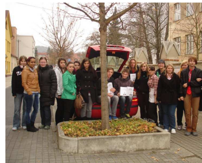
KŘEST MAGAZÍNU STRAKONOMKA – FIKTIVNÍ FIRMA