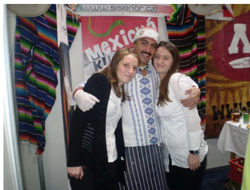
GASTROFEST ČESKÉ BUDĚJOVICE 2012