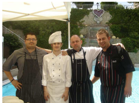
STÁŽE V BAVORSKÉM BAD GRIESBACH