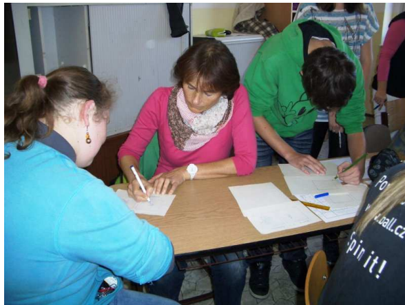
ŠKOLNÍ TURNAJ V PIŠKVORKÁCH