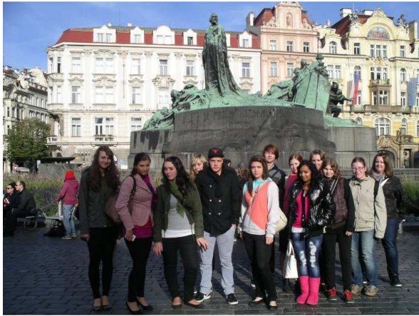
NÁVŠTĚVA DIVADLA HYBERNIA