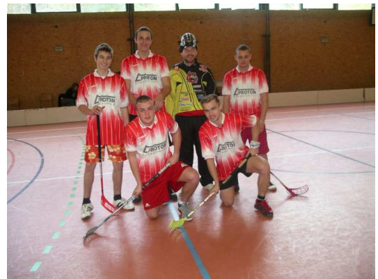
OPEN FLORBAL TRÓJA