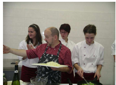
KULINÁŘSKÉ ČAROVÁNÍ S PETREM STUPKOU PRO ŽÁKY