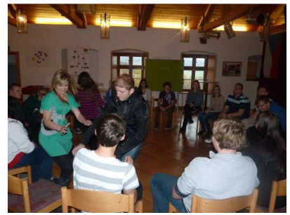
JAZYKOVÝ A PROJEKTOVÝ WORCKAMP WALDMÜNCHEN – NĚMECKO